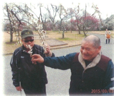
向山梅林公園を散策。開いたばかりの梅に触れ、春の香りを胸いっぱい楽しめます。茶屋でおなかをいっぱいにするのも忘れずに！？