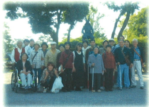
八丁味噌の蔵を見学し、おいしいうどんの昼食後は岡崎城周辺を散策しました。地元の歴史を学んだ一日でした。