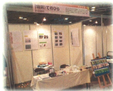
障害者ワークフェア 2014 に出店しました。てのひらでは年間約 30 件の販売イベントに参加しています。