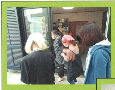
学生さんに手引きしてもらっての避難訓練

豊橋創造大学短期大学部専攻科福祉専攻の学生の皆様の授業の一環として「視覚障害者の理解」、ならびに利用者に対する啓発活動を目的とした『避難訓練』を一日行い、有意義な時間を過ごしました。