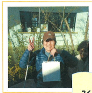
スイーツパーク ニコエ