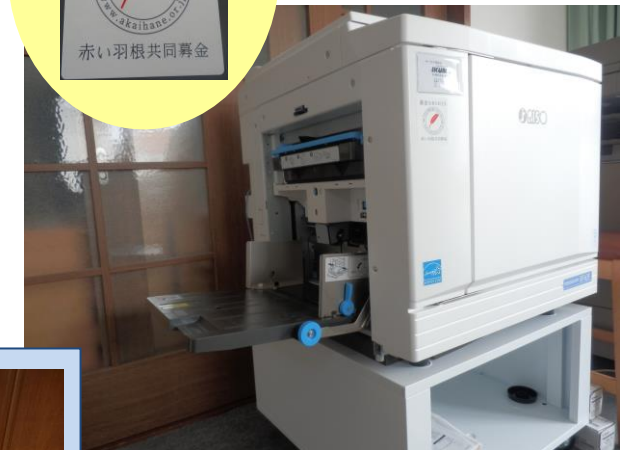
リソグラフ（デジタル印刷機）